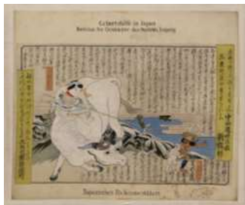
種痘図（佐賀県立図書館所蔵）