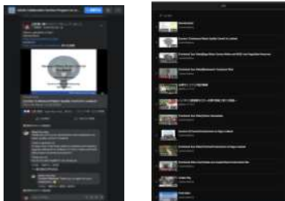
Facebook や YouTube によるプログラム管理