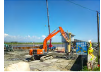
早津江川における新設樋管構築のためのLDis工法施工状況

弊社は、地盤改良工の施工会社として創立30周年を迎えました。これまでに佐賀平野において、河川・道路・港湾事業などに参画してきましたが、弊社の果たすべき役割は、まだまだ多く山積されています。このため、当社保有の地盤改良技術「LDis」や「SJMM」など、専門業者としてのノウハウを様々な社会基盤整備事業に対して技術提案を行い活用してもらうことにより、更なる地域貢献に努めてまいります。